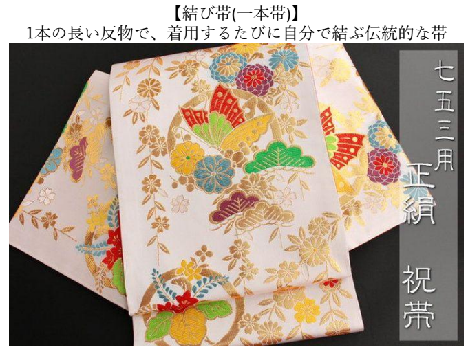
【結び帯(一本帯)】 1本の長い反物で、着用するたびに自分で結ぶ伝統的な帯