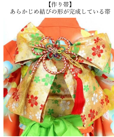
【作り帯】 あらかじめ結びの形が完成している帯