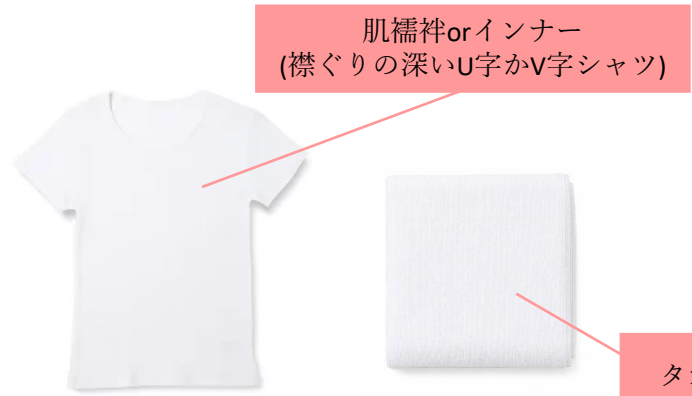
肌襦袢orインナー (襟ぐりの深いU字かV字シャツ)